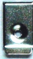
No. 3 脚付